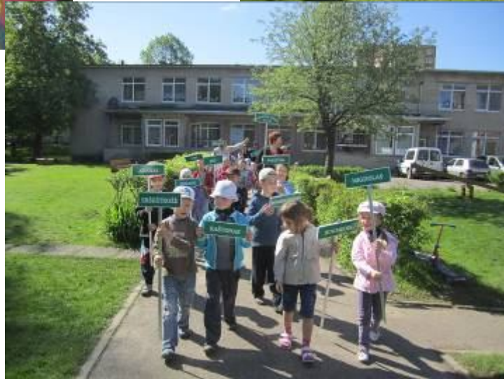
Puoselejam „Svajonių sodą“